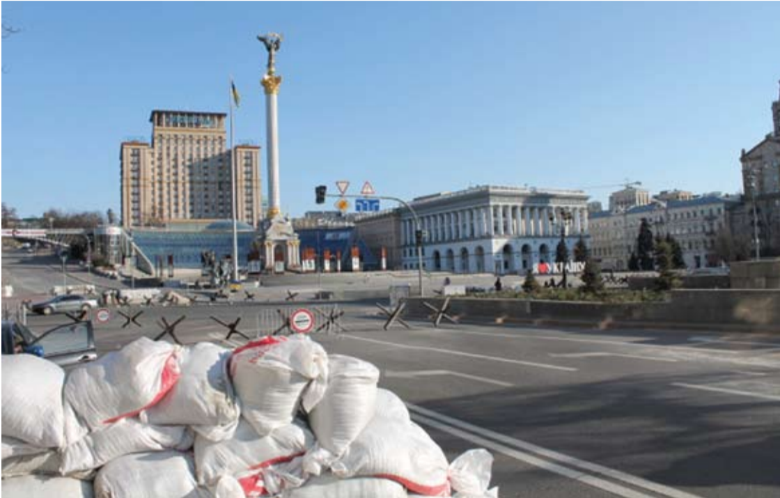
Darant šių nuotraukų prie barikadomis saugomos Nepriklausomybės aikštės gynėjas straipsnio autorių palaikė diversantu.

Antrą mėnesį karo niokojamoje Ukrainoje vis dar važiuoja maršrutiniai traukiniai. Ir žmonės bilietus perka ne tik į Vakarus, į užfrontės miestus. Važiuoja ir į priešingą pusę - į Kijevo ar Charkovą, kuriuose sproginėja bombos.