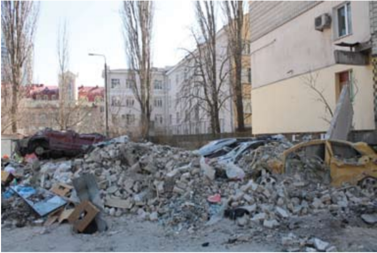
Kieme stovėjusios mašinos liko sumaitotos griuvėsių.