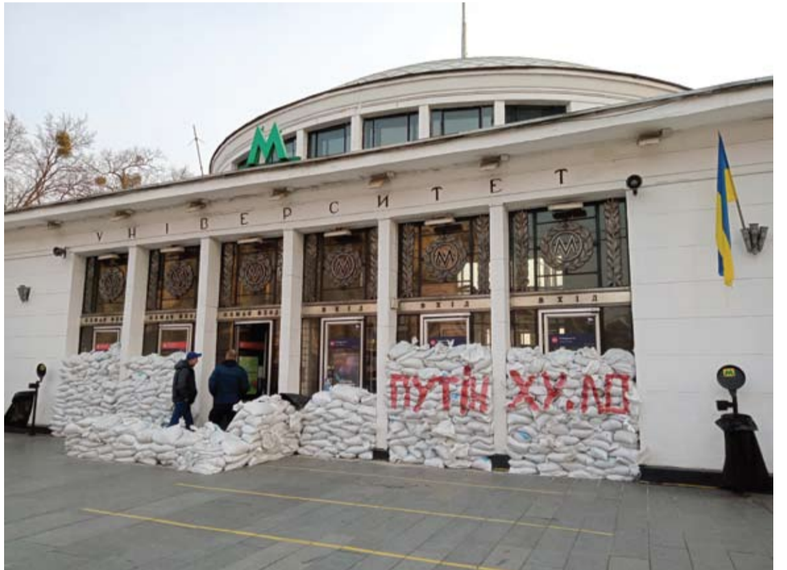
Įėjimas į metro Kijeve.