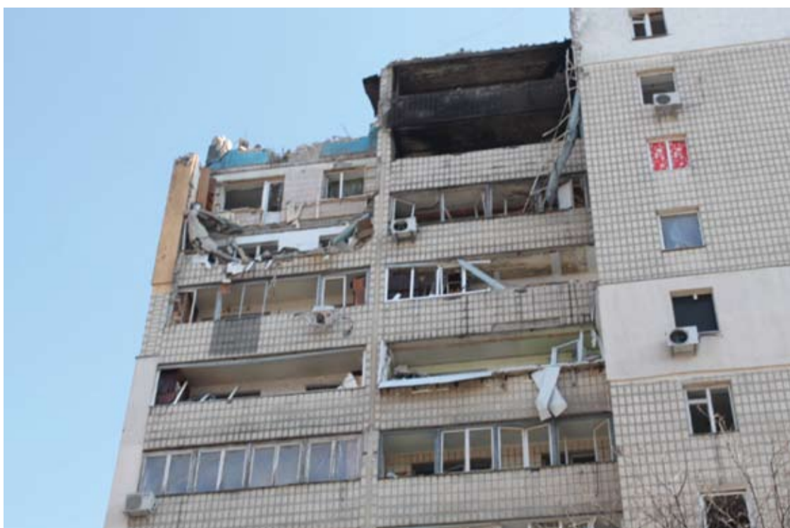
Ukrainiečių numušta raketa nukrito į viršutinį šio namo aukštą ir užmušė pensininką.